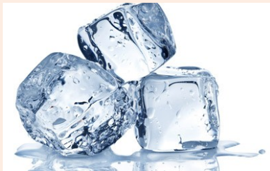
con / senza ghiaccio