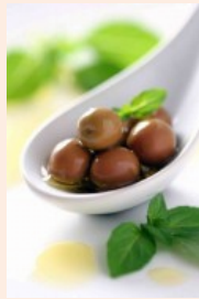
le olive (pl)