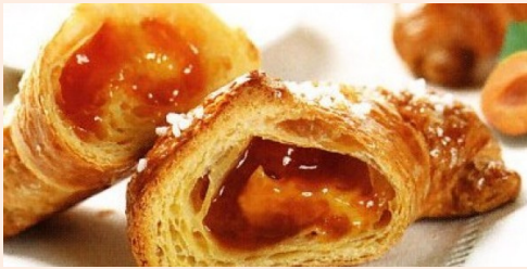
con la marmellata