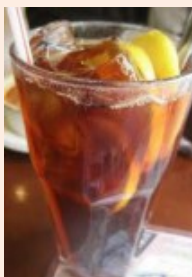
il tè freddo