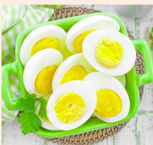
le uova (pl)