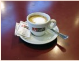
il caffè macchiato