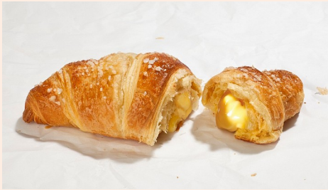
con la crema