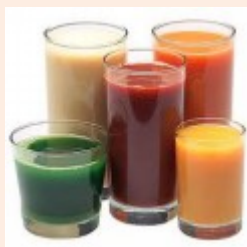
il succo di arancia / di mela / di mirtillo

narancs- / alma- / áfonyalé (szénsavmentes)